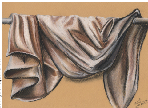
Edwige Jacquet © DR

Utilisé un outil qui depuis le 19 e siècle est l'outil de dessin le plus simple et le plus utilisé dans le dessin d'art, les études, les esquisses. Faire un dessin d'après un paysage de la forêt de Fontainebleau. Apprendre à traduire les matières avec les différentes facettes de l'outil. Obtenir des noirs profonds, des tracés précis, fins ou au contraire très larges, selon la façon dont il est utilisé.