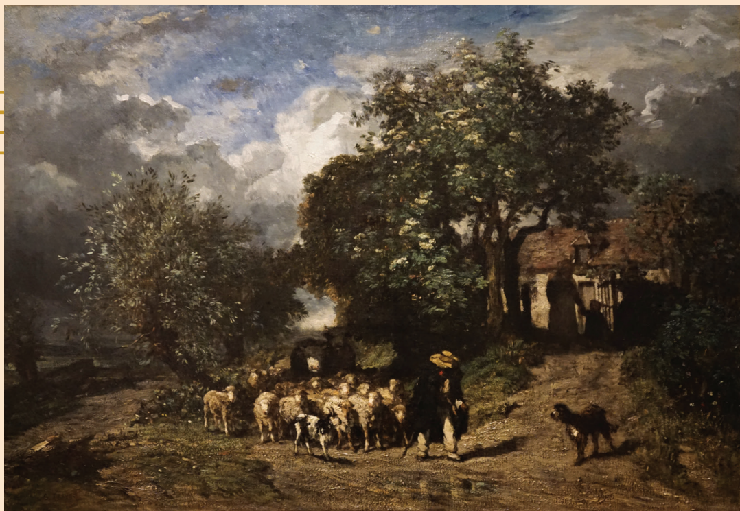
Constant TROYON (1810-1865) « Le retour du troupeau » Dim : 71x101 cm. Collection privée